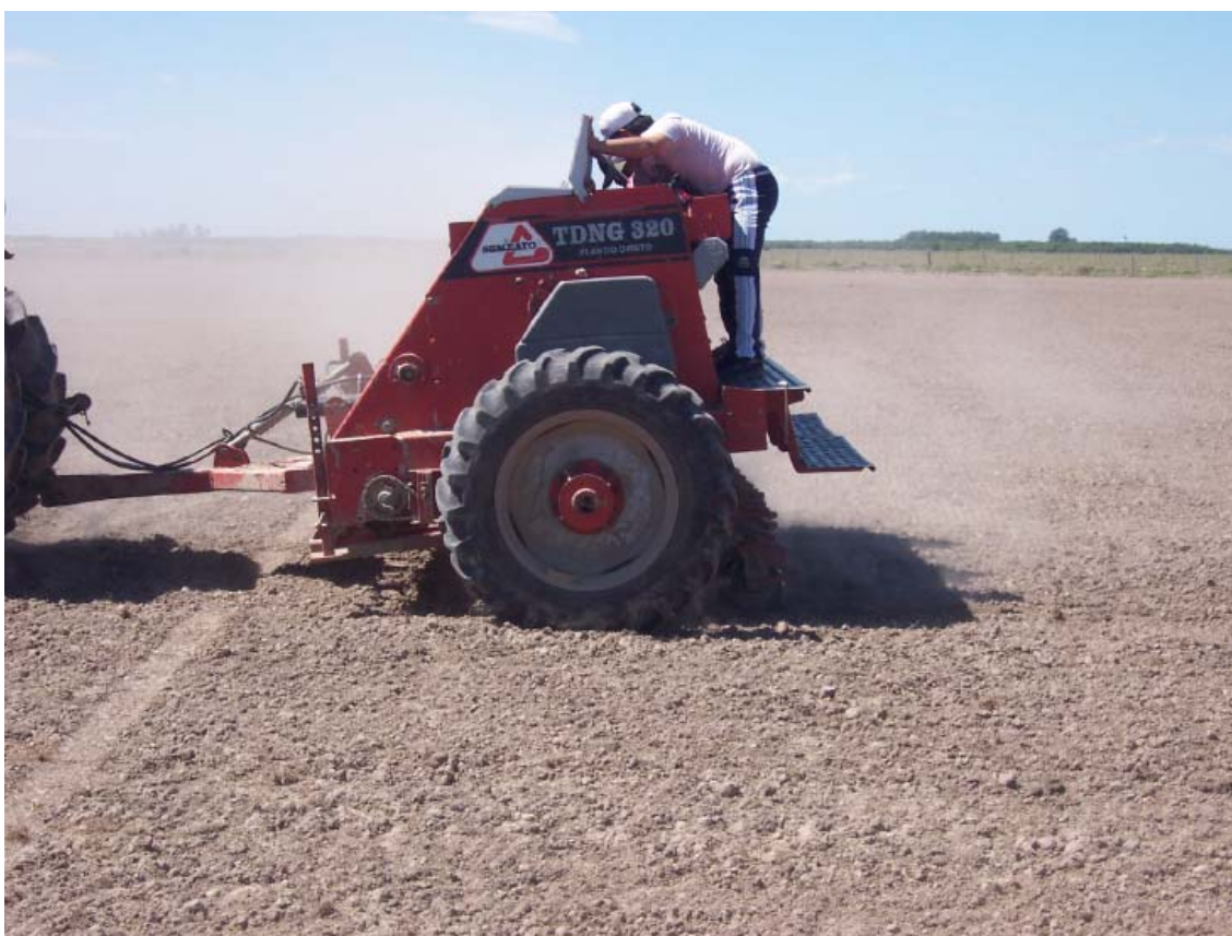
Siembra del ensayo