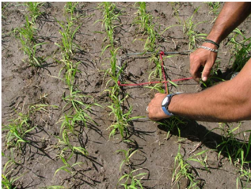
Conteo de plantas